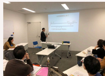
年金ゼミナールプロコースの様子

設楽）コスモの活動の柱として障害年金を中心とした年金相談会というものがあり、この定着を目指していく中で相談担当者はどう育成していくか、増やしていくかということがその当時の最大の課題でしたね。