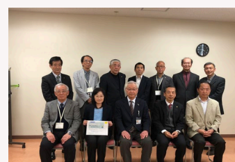
第100回無料年金相談会(ういんぐ)